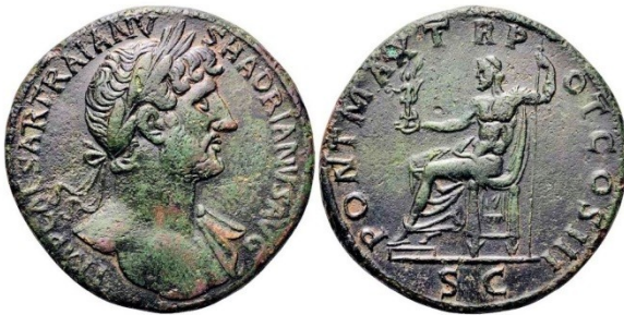
Fig. 8 : sesterce d'Hadrien. Au revers : Jupiter assis sur le trône du roi des dieux. RIC., 561 – C.1183.

Parfois aussi, comme sur le denier de Macrin (fig. 9), il est debout tenant un éclair à la main. A l'époque de Dioclétien, il sera volontiers présent sur les monnaies debout et complètement nu. Chez Licinius, il apparaît accompagné d'un aigle royal et présentant la victoire.