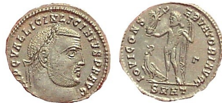
Fig. 11 : follis d'Héraclée pour Licinius I. Au revers : Jupiter protecteur avec l'aigle et la Victoire. RIC. Héraclée, 73.