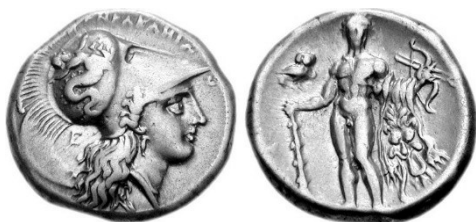
Fig. 6 : Nomos d'argent de Lucanie. Au revers : Hercule en armes. Van Keuren 87.

Après cette introduction nécessaire, nous en arrivons aux monnaies romaines et nous constatons que les Romains, plus prudes que les Grecs ont gardé la même tendance : quelques dieux sont présentés nus, tandis que les déesses se cachent sous de longs voiles.