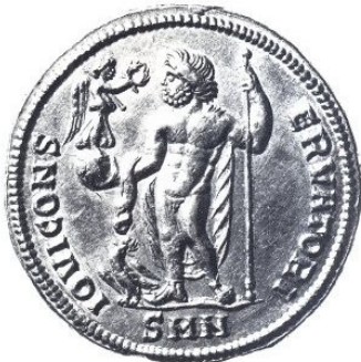
Fig. 10 : médaillon d'or de Nicomédie pour Dioclétien. Au revers : Jupiter protecteur. RIC. Nicomédie, 1. (diamètre : 37,5 mm)