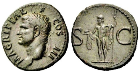
Fig. 12 : as de Caligula en l'honneur d'Agrippa. Au revers : Neptune. C.3.

Caligula, en l'honneur d'Agrippa, fait frapper une monnaie illustrant Neptune tenant un trident et un dauphin (Fig. 12). Peut-être même s'est-il inspiré de la monnaie de Démétrius Poliorcète (Fig. 4). Vespasien, sur un aureus, aura aussi une très belle figure de Neptune.