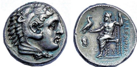
Fig. 3 : Tétradrachme d'argent d'Alexandre le Grand, pour la ville de Pella. Au revers, Zeus trônant. Price, 249. Coll. Pers.