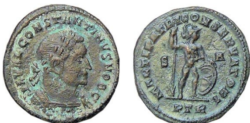
Fig. 7 : Follis de Trèves pour Constantin I César. Au revers : le dieu Mars. RIC VI, Trèves, 691.

Après cette introduction nécessaire, nous en arrivons aux monnaies romaines et nous constatons que les Romains, plus prudes que les Grecs ont gardé la même tendance : quelques dieux sont présentés nus, tandis que les déesses se cachent sous de longs voiles.