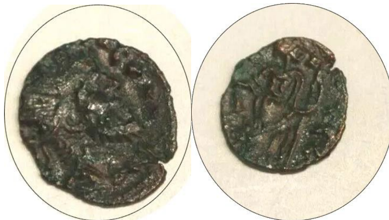
Monnaie de bronze romaine à la fin de l'Empire...

La numismatique n'est pas seulement l'étude des monnaies anciennes. Elle permet de lire dans le métal les forces et les faiblesses des sociétés qui les ont frappées. Ainsi, les pièces romaines témoignent à la fois de la grandeur d'un empire et du long effacement qui suivit sa chute. Lorsque Rome s'est effondrée, il n'y eut ni révolution ni soulèvement populaire. Seulement un lent abandon des structures : les impôts n'étaient plus collectés, les routes et aqueducs s'effritaient, l'armée dépendait de mercenaires étrangers, et les élites locales se repliaient sur elles-mêmes. L'ordre social s'est dissout. Pendant plusieurs siècles, en Occident, l'histoire est entrée dans un brouillard que l'on nomme encore « âges sombres ».