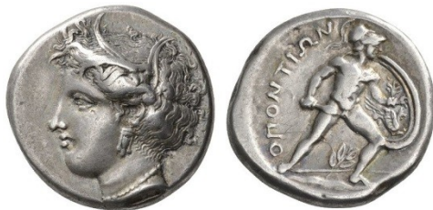
Fig. 2 : Statère d'argent de Locres. Au revers, le héros homérique Ajax. B.M.C. 8.12.

Avant d'aborder la nudité sur les pièces romaines, je dois faire quelques remarques sur la numismatique grecque, car elles resteront applicables à la numismatique romaine.