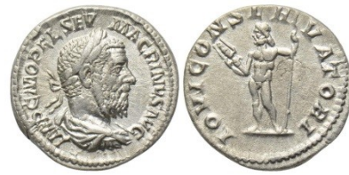
Fig. 9 : denier de Macrin. Au revers : Jupiter protecteur tenant un sceptre et un foudre. RIC. 73.