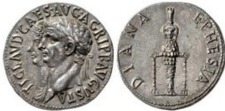
Fig. 1 : Claude et Agrippine sur un cistophore d'Ephèse. (C.1) Au revers : DIANA EPHESIA ; statue de l'Artémis d'Ephèse.

La nudité sur les pièces pourrait donc se présenter comme un thème de collection visant à reproduire chez soi une véritable glyptothèque en petit format. Qui ne souhaiterait, en effet, retrouver sur ses pièces la Vénus de Milo, le Doryphore de Polyclète ou l'Hermès de Praxitèle ? N'y a-t-il pas là une belle galerie de sculpture antique à exploiter en monnaies ?