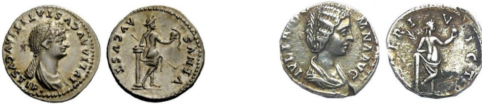
Fig. 16 : denier (x2) de Julia, fille de Titus. RIC 388 et de Julia Domna. RIC. 536. Au revers : Venus victorieuse

portent cette gracieuse figure de l'amour. (Fig.16)