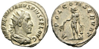
Fig. 13 : antoninien d'Emilien. Au revers : Apollon protecteur. C. 2 – RIC. 1.

D'Auguste à Julien l'Apostat, Apollon promène sur nos monnaies sa grâce un peu féminine, agrémentée d'une lyre ou d'un arc.