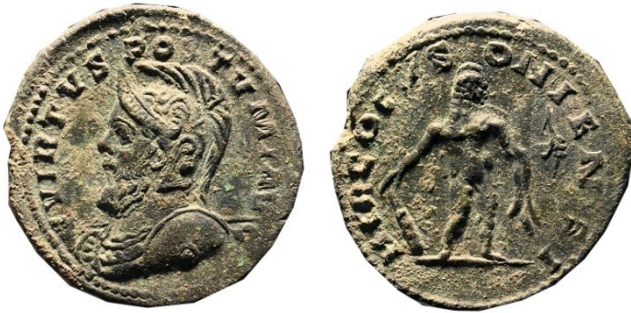
Fig. 14 : sesterce de Postumus. Au revers : Hercule « deusoniensis » C. 105-106.

Mais la divinité la plus populaire et la plus musclée de nos médaillers est incontestablement Hercule qui affronte sans cesse les monstres les plus divers en exposant généreusement sa musculature impressionnante. Symbole de la force et de la jeunesse, Hercule est la figure la plus familière du petit peuple. Les pièces de Postumus rendent un hommage particulier à Hercule. (Fig. 14) Mais la dernière représentation du héros populaire, nous la trouverons sur les folles de Licinius père et Constantin I (Fig. 15).