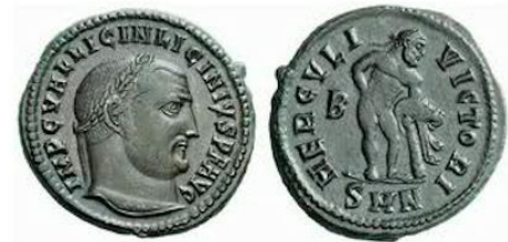
Fig. 15 : follis de Nicomédie pour Licinius I. Au revers : Hercule victorieux. RIC. VI, Nicomédie, 565.

Il est évident, pourtant, que du 1 er au 4 ème siècle, les graveurs n'ont pas toujours travaillé avec le même art, la même maîtrise : si les monnaies des 250 premières années de l'histoire de l'empire nous montrent des nus bien dessinés, musclés, aux mouvements harmonieux et aux poses élégantes, le 4 ème siècle nous présente des poses figées, des figures stéréotypées.