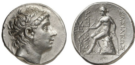
Fig. 5 : Tétradrachme d'argent de Syrie pour Antiochus III. Au revers : Apollon. B.M.C 4.17.