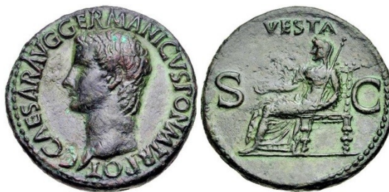
Fig. 17 : as de Caligula. Au revers la déesse Vesta, vêtue en matrone romaine. RIC. 38.

Les Romains, peuple de paysans et de guerriers, restent dans l'ensemble fort prudes sur le sujet des femmes et de l'amour. Que l'Art d'aimer d'Ovide ne nous trompe pas : les descriptions précises se rapportant à l'amour manquent singulièrement dans la littérature latine. Seules les courtisanes et les esclaves se présentent dévêtues, ou légèrement vêtues en public, certainement pas les femmes de bonne famille et encore moins les déesses, même sur les monnaies !