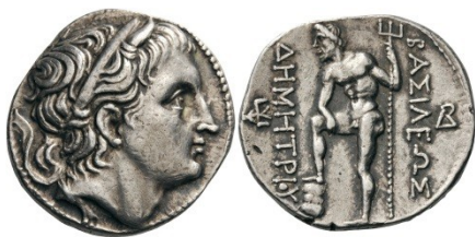
Fig. 4 : Tétradrachme d'argent d'Amphipolis pour Demetrios Poliorcetes. Au revers : Poséïdon. Pozzi 959.