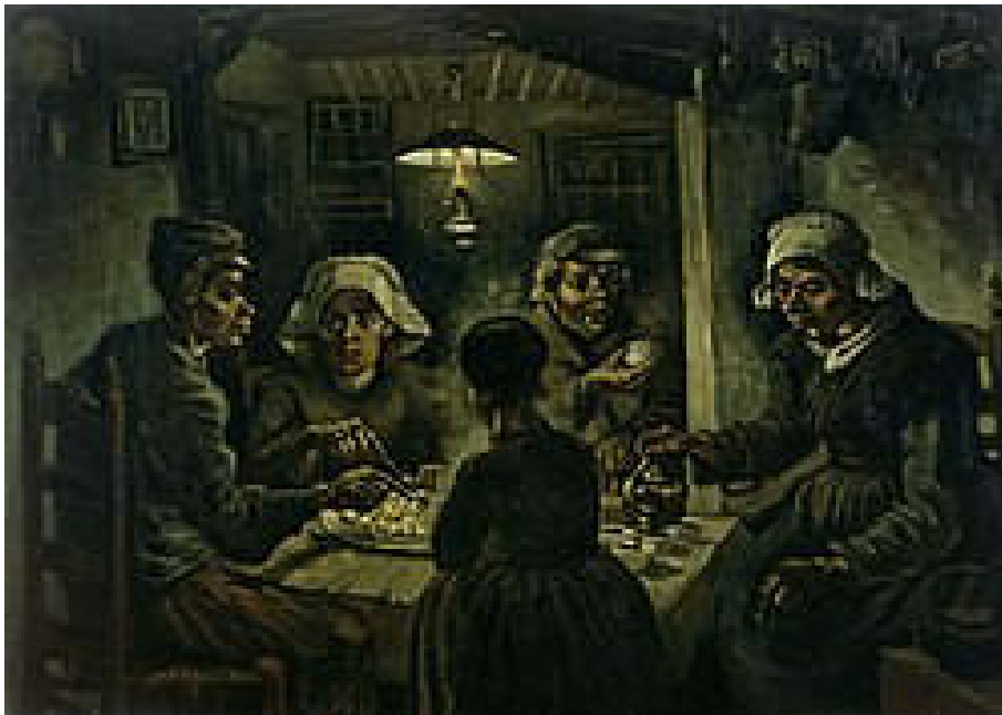
Vincent van Gogh : Les Mangeurs de pommes de terre.

Une Caisse d'Épargne fut également créée. Les insulaires pouvaient utiliser des espèces sud-africaines ou britanniques, qui étaient interchangeables, toutes deux étant des monnaies sterling. Cependant, un approvisionnement correct en espèces n'atteignit pas Tristan avant 1944. L'administrateur colonial Hugh Elliott découvrit avec étonnement que même d'anciennes pièces remontaient à la surface : des couronnes de George IV et d'anciens cents hollandais et américains ressortaient "de leurs bas respectifs". La notion de monnaie était si étrangère aux habitants que des cours sur la "monnaie" durent être donnés à l'école pour familiariser la population avec ce concept.